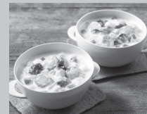
▲クラムチャウダー

ところですね。しかも、解凍いらずで「入れて・煮て・混ぜるだけ」。想像以上に簡単で、忙しい夕方に大助かりでした。ビオサポ食材セット、 完全に「母の味方」でした!