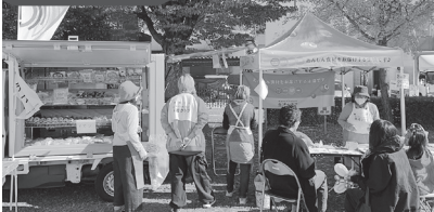
▲キャラバンカーで参戦！ 地域のマルシェで生活クラブをアピール