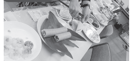
▲クリスマス&お正月試食会 盛り付けも腕の見せ所