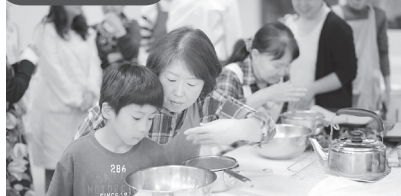
▲クリ正試食会@岡崎りふら エビの食比べ。ゆで汁の香りはどうかな～