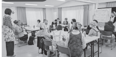
▲クリスマスお正月試食会 昭和東・瑞穂コミ主催。おいしく食べて学んで！