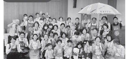
▲つばさフェスティバル スタッフ総勢50人！最強キッズも大活躍！