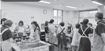
▲コーミ生産者交流会 ケチャップ作りをしました