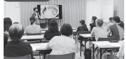
▲和髙スパイス生産者交流会 生産者のお話に引き込まれます