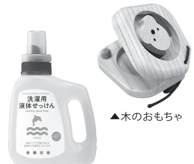
▲洗濯用液体せっけん

出産した時に、赤ちゃんにやさしい「出産祝いセット」がもらえます。内容は洗濯用液体せっけん、固形せっけん、木のおもちゃ(2,000円相当)です。申請が必要です。申請期限は、1歳の誕生日の前日までです。