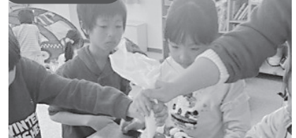
▲身体に優しいごはんの会 クリスマスケーキ作りしました