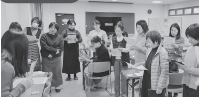
▲防災講座 防災意識をアップデート！