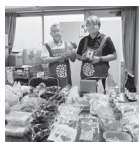
▲紀伊半島地域協議会

【来場生産者】 コーミ、トーエー食品、みえぎよれん販売、三重県漁連、おとうふ工房いしかわ、坂利製麺所、美濃愛農産直、下津醤油、音羽米を育てる研究会、わっぱん、エスケー石鱈、酒井産業、紀伊半島地域協議会、彩生舎、かたやま工芸