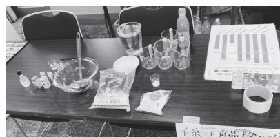
▲無果汁飲料作りとウインナーの発色剤テストを実施