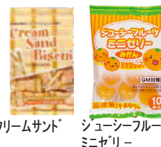
全粒粉入クリームサンド シューシーフルーツ ミネゼリー

ハグくみ、《たすけあい》、 《あいぶらす》を加入検討 中の方は紹介カード提出で 消費材をプレゼントします 2019/8/31 まで