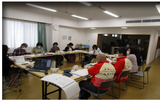
4月委員会の光景： 実参加と画面越し Zoom 参加

こどもたちが社会人になり、自分の時間もでき、何かしなくては…と思っていたところ、名古屋北エリア経営委員会の方から声をかけていただきました。