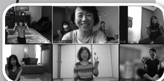
講師本人はこの体操で腰痛を克服しました

講習費 1,500円 締切 開催日4日前(締切後でも定員内に限り平日夕方4時まで受付可)