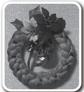
Menu クリスマスリース